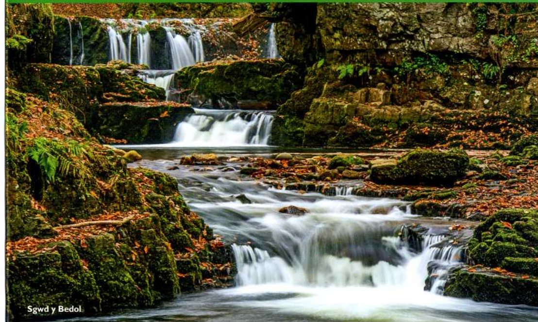
Sgwd y Bedol