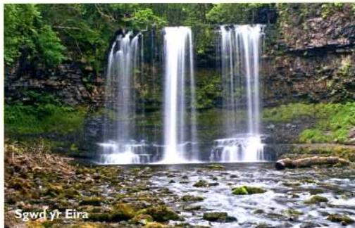
Sgwd yr Eira