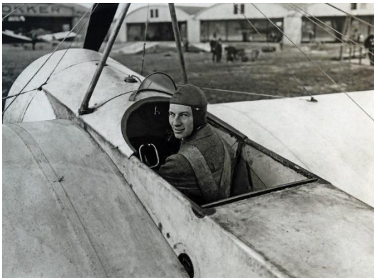
Anthonie Fokker (1890 – 1939), Nederlandse vliegtuigbouwer voor de Duitsers, 1914. De Fokkerfabriek stond in Schwerin.

Two Dutch soldiers from the storm school with a flamethrower in a trench.