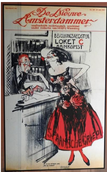
De Spaanse Griep meldt zich bij het bevolkingsregister. Deze ziekte kostte uiteindelijk miljoenen mensen het leven. Spotprent uit de Eerste Wereldoorlog.

Portrait of a Senegalese. This man was made prisoner of war in Belgium during the First World War. It was the first colored prisoner of war by the Germans. The Germans were so impressed that they deported Senegalese 500 prisoners of war to Berlin to be exhibited there at the zoo. Emperor Wilhelm II was so impressed by this man that he had a painting made, which he hung in his office as a trophy. The man depicted here survived the First World War and continued to live in Germany. In 1941, however, he was deported to the concentration camp by the Germans, where he was assassinated that same year.