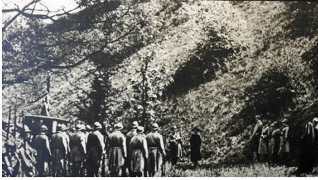
Executie van Mata Hari in Frankrijk