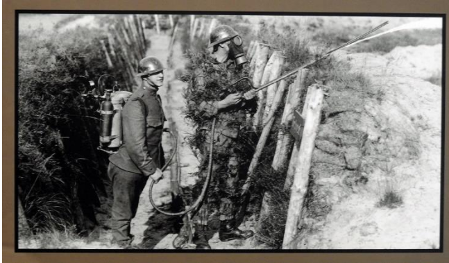
Twee Nederlandse militairen van de stormschool met een vlammenwerper in een loopgraaf.

War photographer Van Es at Soesterberg air base in 1918. He prepares his camera for taking aerial photographs.