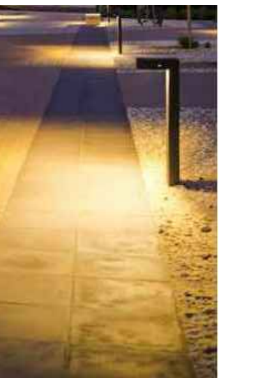
Verlichting langs hoofdpad Ligman - Light Linear PT1