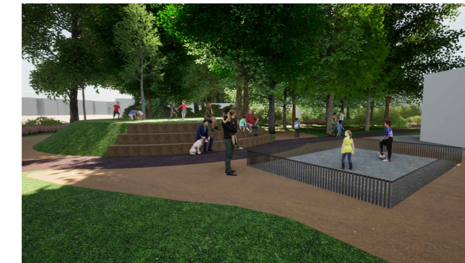
3D impressie: Tribune en pannakooi