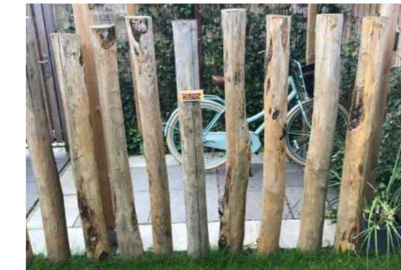
Geschilde palen als afscheiding