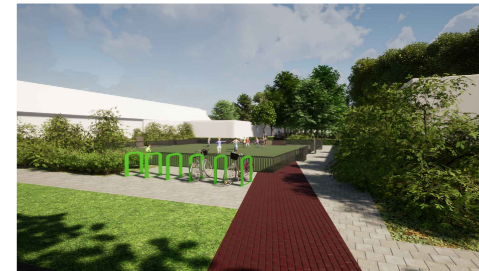
3D impressie: Aanzicht vanaf Dorpsstraat met fietsrampjes en sportveld