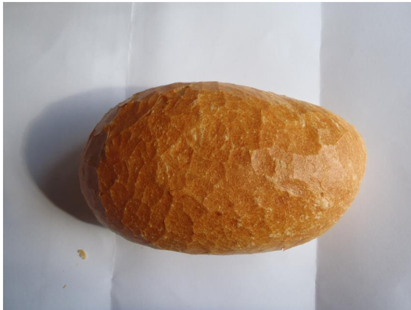
Petit pain pistolet / Klein wit broodje ovaal € 0,35