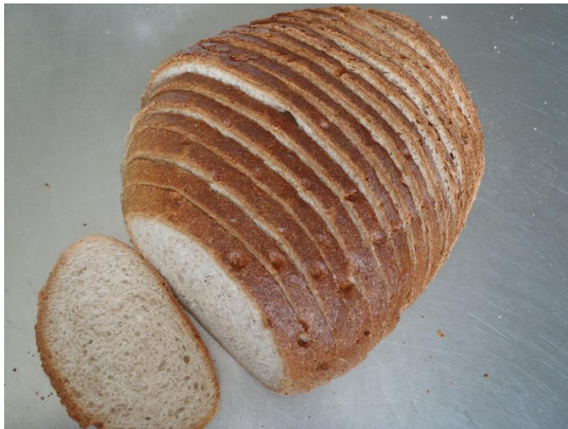
Pain gris / Bruin brood (groot), gesneden € 2,40