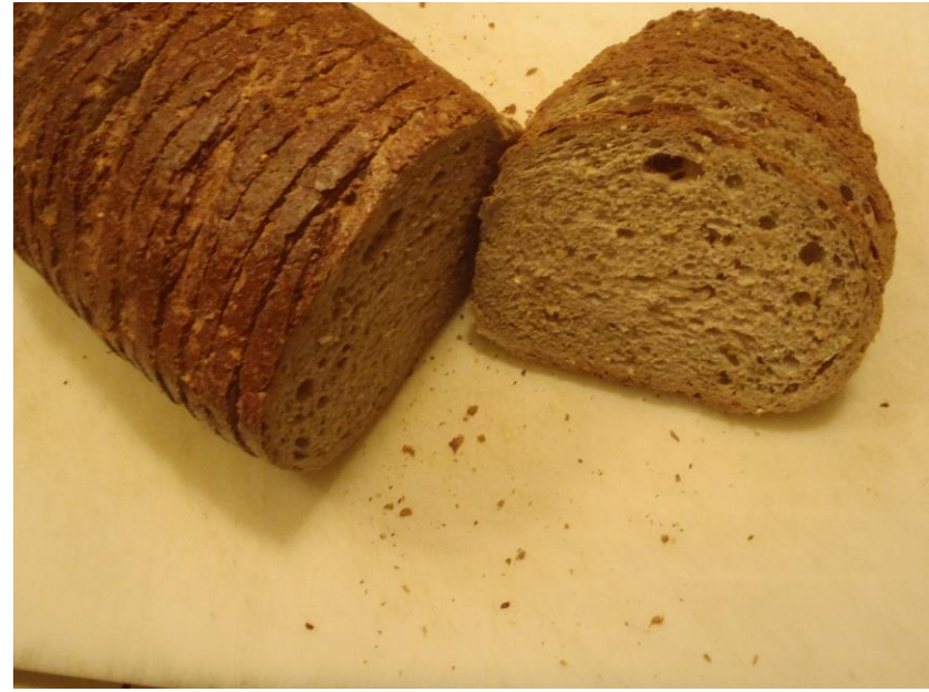
7-Cereal / 7-Granenbrood (groot), gesneden € 2,60