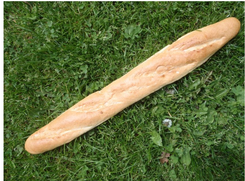
Baquette / Stokbrood € 1,25