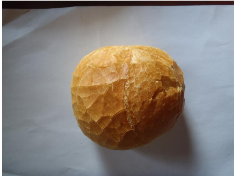
Petit pain blanc / Klein wit broodje rond € 0,35