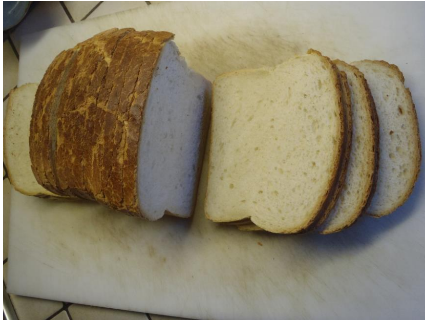
Pain blanc / Wit brood (groot), gesneden € 2,30