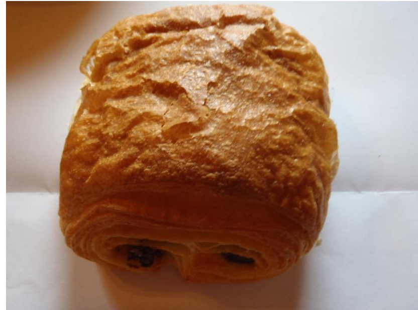
Pain aux chocolat/creme / Chocoladebroodje met crème/roompudding vulling € 1.15