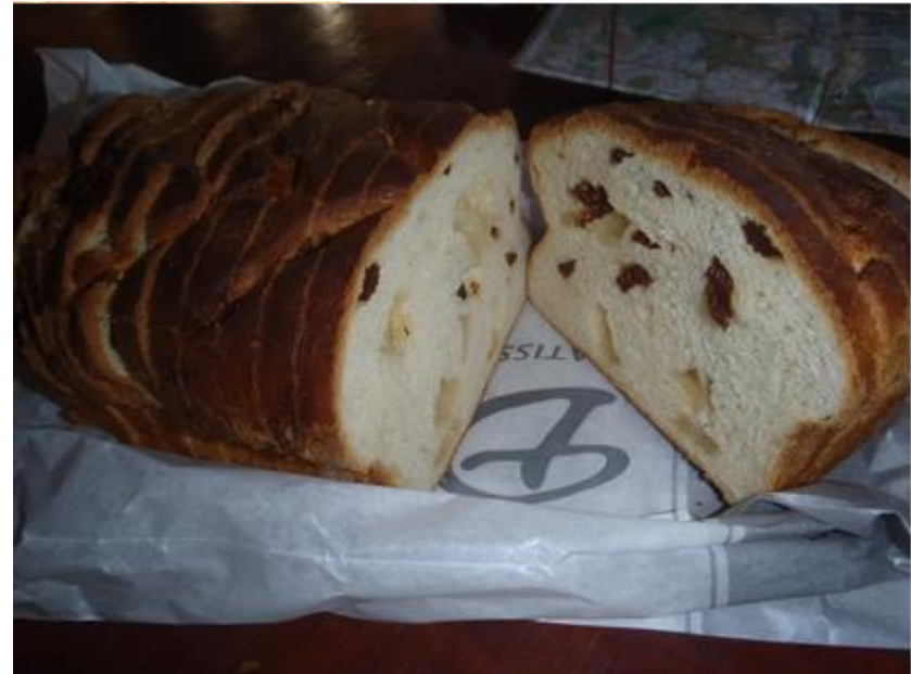
Petite Cramique / Rozijnen-suikerbrood € 2,45