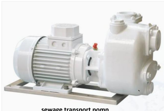
sewage transport pump