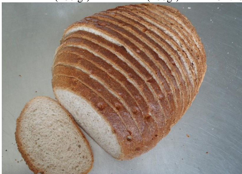
Pain gris (800 gr) / Bruin brood (800 gr) € 3,10 (400 gr) (400 gr) € 2.30