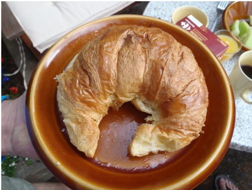
Croissant € 0,95