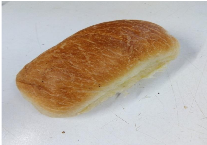
Petit pain Sandwich / Klein wit broodje zacht € 0,80