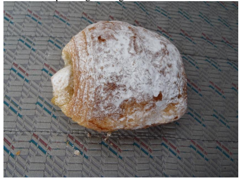
Croissant aux pommes / Croissant met appel € 1,25