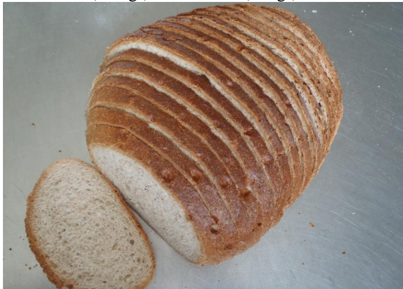
Pain gris (800 gr) / Bruin brood (800 gr) € 2,60 (400 gr) (400 gr) € 1.90