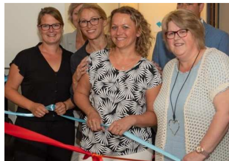
De vier ziekenhuis-CJG'ers bij de opening.

Het ziekenhuis-CJG is een initiatief van de negen samenwerkende gemeenten in de regio West-Brabant West. Eerder is dit concept met succes geïmplementeerd bij het Amphia ziekenhuis.