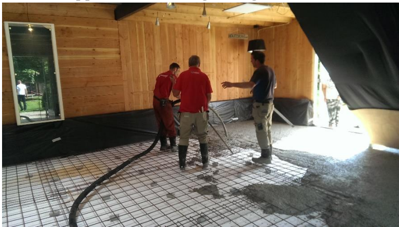
De geïsoleerde betonvloer wordt gestort