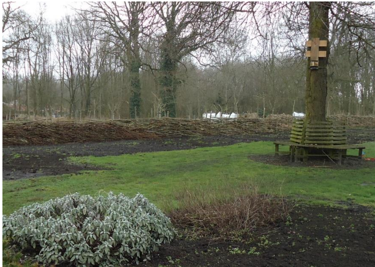
Van wilgentenen gevlochten hek

Om het woekeren van onkruid in de winterperiode te remmen, zijn er op maat geknipte stukken antiworteldoek op de niet in gebruik zijnde delen van de moestuin gelegd. Nadat er compost is opgebracht is de grond met een frees geschikt gemaakt voor poten van de verschillende aardappel- en groentesoorten. De bramen- en frambozenoogst is verwerkt tot jam, dit is een onderdeel van het kerstpakket voor de