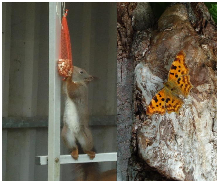
Bezoekers op 't Helmgras

We zijn vrijgesteld van het doen van aangiften voor de omzetbelasting. Over onze omzet hoeven we geen BTW af te dragen. Daar staat tegenover dat we de door ons betaalde BTW op onze inkopen niet kunnen verrekenen.