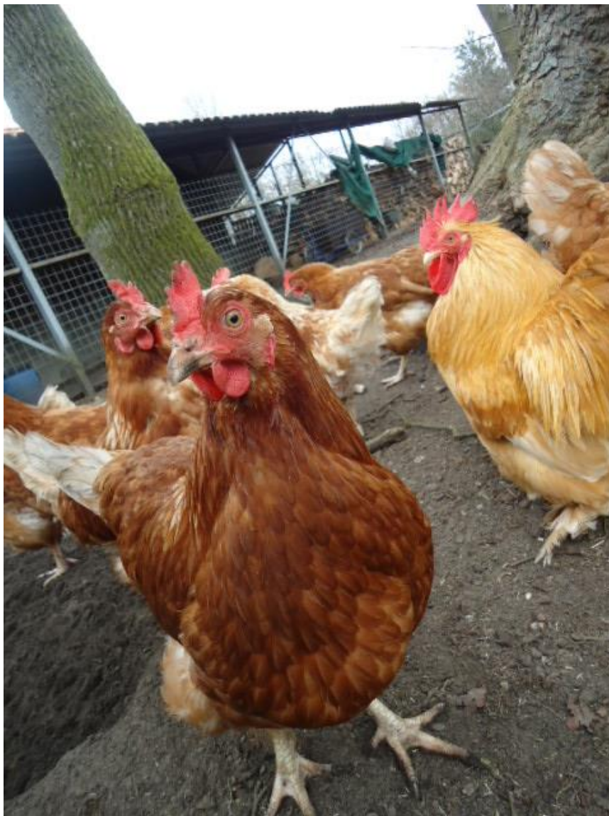
Onze medewerkers van de ei afdeling