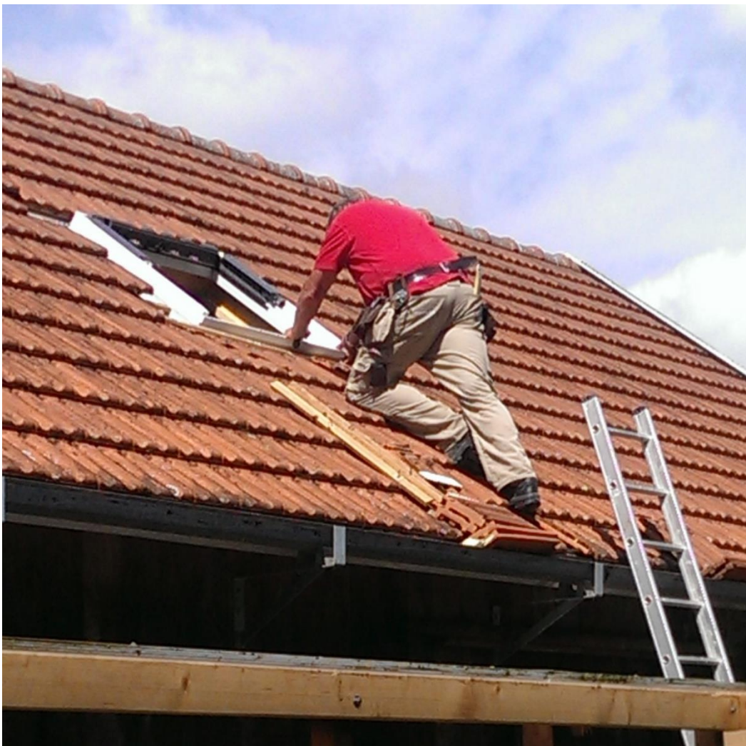
Een dakraam in het nieuwe Atelier

Jaarlijks wordt de huur aangepast met een percentage dat landelijk wordt vastgesteld door de Minister van Binnenlandse Zaken en Koninkrijksrelaties. In 2021 is besloten dat er tot 30 juni 2022 geen huurverhoging mag worden toegepast voor sociale huurwoningen.