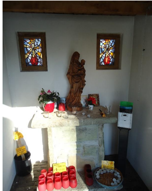
Kaarsen in de Mariakapel

Mooie schilderijen zijn er gemaakt. Op papier of doek, abstract of realistisch, in warme of koude kleuren. Vrije ideeën of 'een ode aan een kunstenaar'. Olieverf of acryl, ingelijst achter glas of houten lijst. In ieder geval met veel liefde gemaakt en voor ieder wat wils!