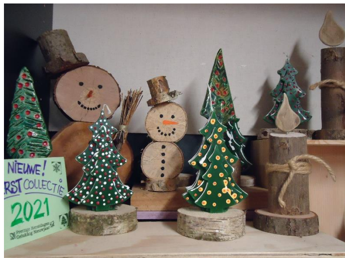
We waren wel klaar voor de kerstverkoop...

perkgoed, vaste planten keramiek, kaarsen houtdraaiwerk en honing. In november en december hebben we voor het tweede jaar achtereen de verkoop van kerstbomen en kerstproducten geannuleerd. In de wijkkranten hebben we aangekondigd dat we vanwege het Covid19 virus gesloten bleven.