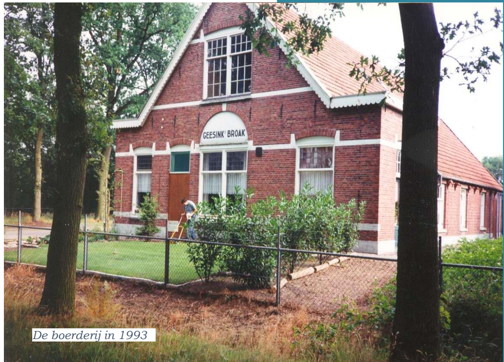
De boerderij in 1993

Vereniging 't Helmgras Rondemaatweg 75 7544 NJ Enschede www.helmgras.nl 053-4781505