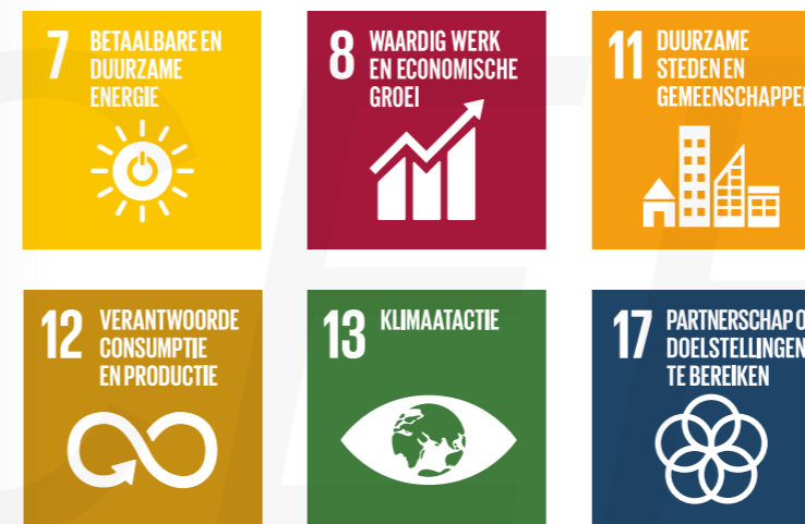
Figuur 3: SDG's waaraan Twence wil bijdragen

Op basis hiervan zetten we in de periode 2024-2027 de volgende zes SDG's centraal: