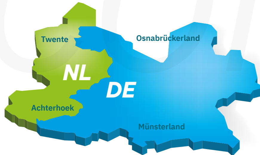
Figuur 2: Euregiogebied

Daarnaast spelen er zaken als een (zeer) krappe arbeidsmarkt, steeds meer impact van het klimaat (denk bijvoorbeeld aan droogte en de zorgen over de beschikbaarheid en kwaliteit van ons drinkwater), de aanpak van de reductie van stikstof of een tekort aan woningen. Forse uitdagingen die impact kunnen hebben op de wijze waarop Nederland - en daarmee Twence - zich de komende jaren kan ontwikkelen. In algemene zin zien we een ontwikkeling naar regionalisering nu de grenzen van de globalisering lijken te zijn bereikt. De ontwikkeling van Twence naar Euregionaal duurzaamheidsbedrijf past in deze ontwikkeling.