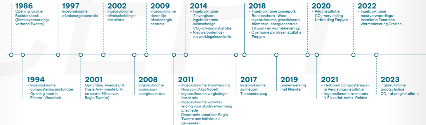
Figuur 1: historie Twence

In de afgelopen decennia is Twence flink gegroeid en zijn steeds meer activiteiten ontplooid die passen in de rol van duurzaamheidsbevorderaar. Denk aan de ingebruikname van de gereviseerde biomassaenergiecentrale waarin regionaal afvalhout middels verbranding wordt omgezet in stoom en warmte, de kleinschalige afvang van CO 2 , de ingebruikname van de zonneparken Boldershoek-West en Tienbunderweg, het warmtenet Enschede, de stoomleiding naar Nobian en de overname van pyrolyse-installatie Empyro. De ontwikkeling van Twence is hierna grafisch weergegeven.