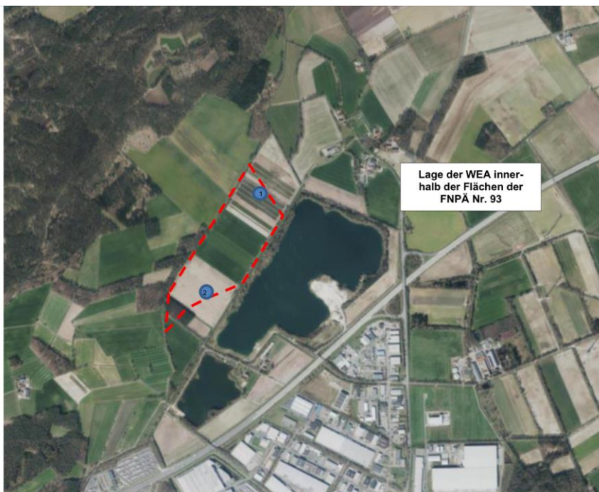
Abbildung 1: Luftbild mit blau dargestellten WEA/Flächen der FNPÄ Nr. 93, unmaßstäblich (NLWKN 2022)

Tijdens de vergadering van 5 juli 2023 heeft het beheerscomité van de stad Bad Bentheim besloten over het ontwerp van de 93e wijziging van het landgebruiksplan in het gebied "Windpark Holt en Haar" in de momenteel geldende versie.