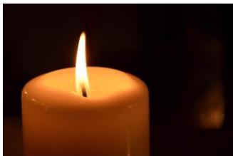
Het ontsteken van de gedachteniskaars