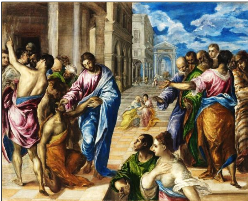
El Greco, Christus geneest de blinde bij Siloam 1570

“Als gij blind waart, zoudt gij geen zonde hebben, maar nu gij zegt: wij zien, blijft uw zonde.”