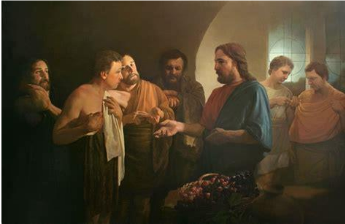
Schilderij van Andrey Mironov

ze zullen aanzitten in het rijk van God. Denk eraan: er zijn laatsten die eersten en eersten die laatsten zullen zijn.'