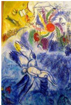
De schepping van de mens. Marc Chagall 1958