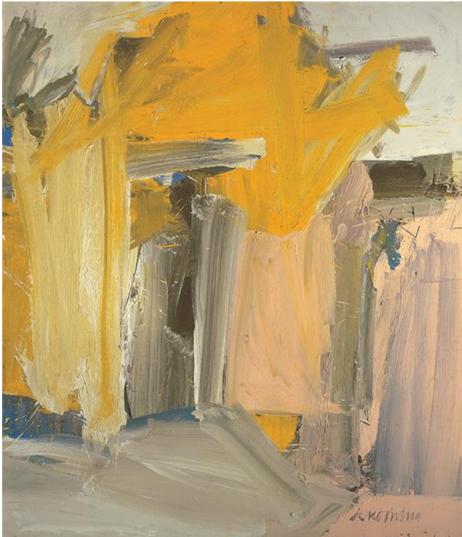
Door to the river, Willem de Kooning 1960