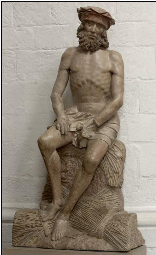
Job op de mesthoop. (1400-1430) Het beeld was vroeger gepolychromeerd Sint-Martinuskerk, Wezemaal (Brabant)