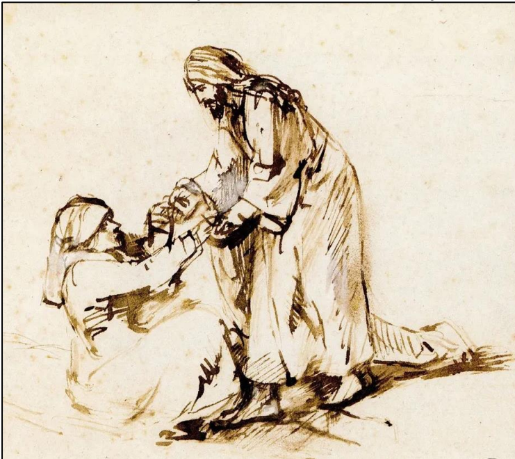
Rembrandt: De genezing van de schoonmoeder van Petrus (rond 1658) Pentekening

Hij ging naar haar toe, pakte ze bij de hand en deed haar opstaan; zij werd vrij van koorts en bediende hen. In de avond, na zonsondergang, bracht men allen die lijdend of bezeten waren bij Hem.