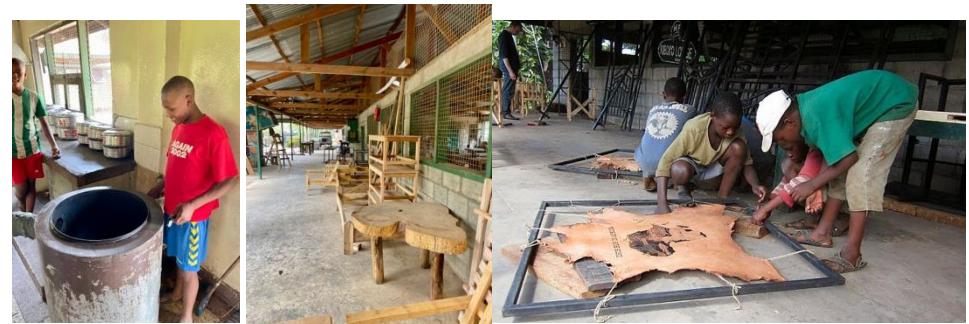
Eten koken voor elkaar, de ambachtsschool, hout en leer