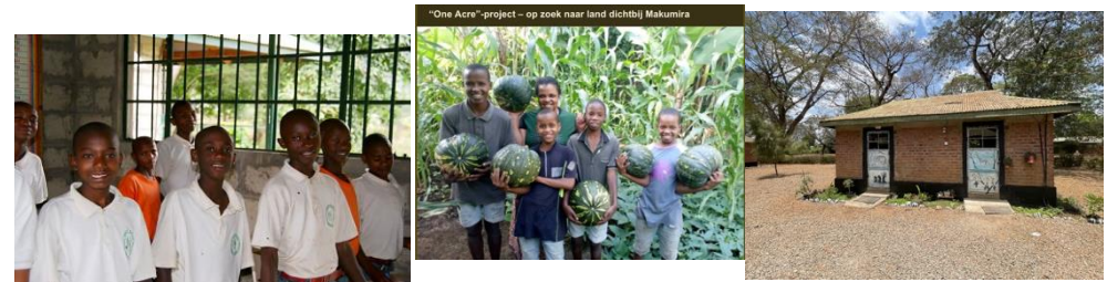
In de klas, landbouwproject “on acre”, woning voor zes leerlingen